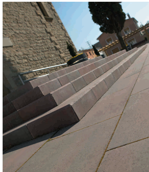
Foto Inferior. Plaza de la Iglesia, St. Miquel de Balenyà. Barcelona. P51. Ref. Volcano Bottom Photo. Church square, St. Miquel de Balenyà. Barcelona. P51. Ref. Volcano

It is a small piece with a length that enables its installation in building projects. Furthermore, the colour-contrast achieved with the paving provides an extra visual element alerting the pedestrian to the presence of a drop, therefore reducing the risk of an accident.